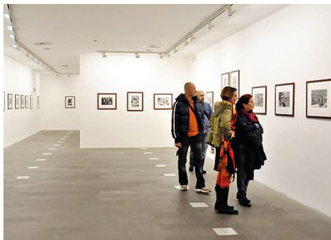
Visitatori al museo Man

“ Servirebbe un portale internet, una vetrina completa un cartellone unico