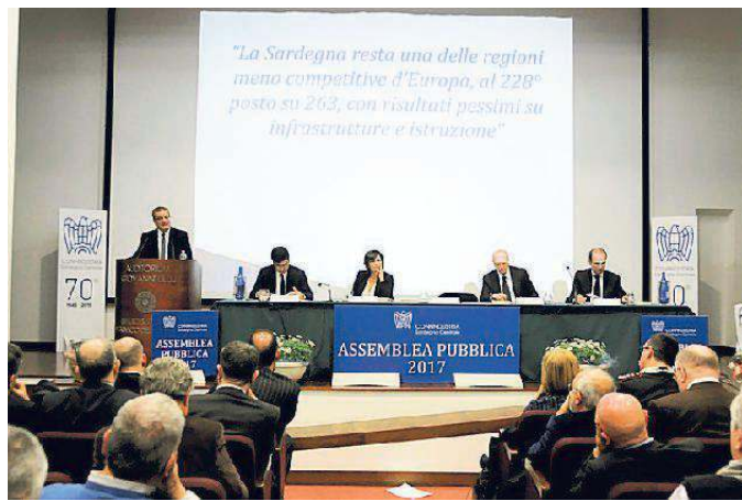
L'affollata assemblea a Nuoro organizzata da Confindustria