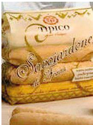
Biscotti di Fonni

Una gestualità che consolida le amicizie, creando un vincolo quasi di fratellanza tra i