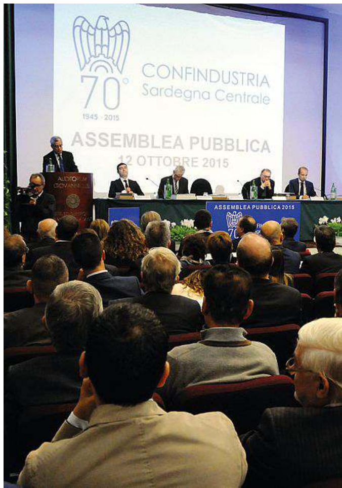
In alto un momento dell'assemblea di Confindustria Sardegna tra i partecipanti anche il presidente Giorgio Squinzi

Lo spopolamento. Il Nuorese perde pezzi, dice il leader di Confindustria, e si spopola: «Ciò che colpisce è l'impressionante calo demografico che negli ultimi decenni ha colpito soprattutto il territorio di Nuoro: in pratica, dal 2001 a oggi, la provincia ha perso un abitante su cinque. Assistiamo così a un alto numero di abitazioni non occupate, una popolazione strutturalmente anziana e un mercato del lavoro asfittico». Il paradosso per Squinzi è proprio