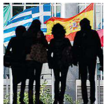
La sede dell'Ue a Bruxelles

biamo credere fino in fondo. È una grande sfida e lo è prima di tutto perché dobbiamo dimostrare che con i finanziamenti europei le comunità, anche quelle più periferiche e spopolate, cambiano e possono avere una marcia più in uno sviluppo duraturo». Sì, la ripresa dovrà essere resistente: «Le fiammate sarebbero solo un'illusione», ha detto il presidente Markkula. Bisogna aggrapparsi alla tecnologia, alle nuove energie, all'istruzione, al lavoro, alla qualità della vita e alla lotta alle povertà, per ricordare alcuni degli 11 progetti in cui la Sarde-