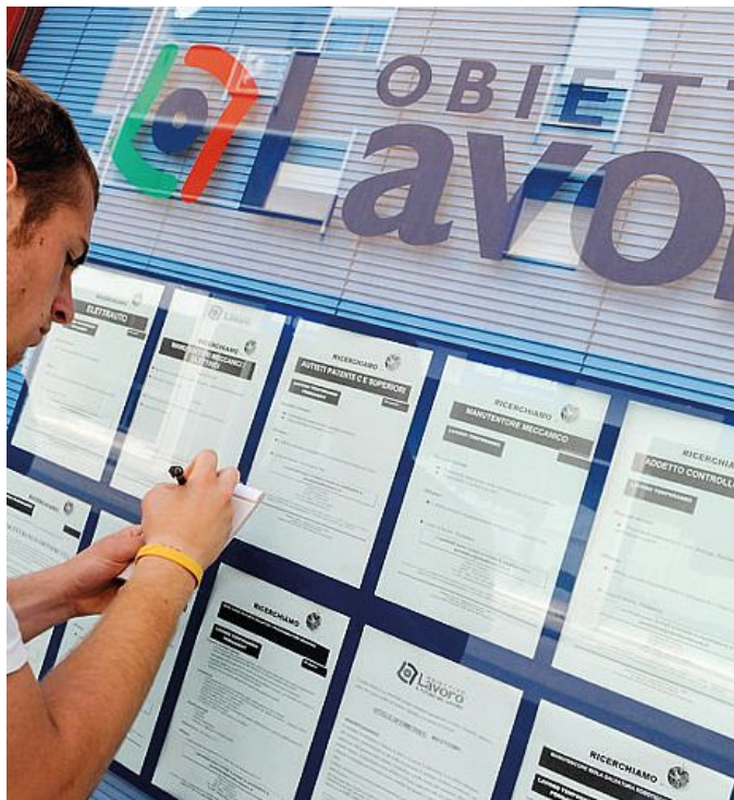
Un nuovo progetto unitario contro la crisi del mondo del lavoro

La soluzione. «Per superare l'emergenza occorre una terapia d'urto e un progetto organico, e trasversale a tutti i settori, in grado di creare nuove prospettive di crescita e di occupazione», è scritto nella nota, che così continua: «La proposta progettuale è aperta alle integrazioni e ai contributi delle altre forze politiche e istituzionali del Territorio e una volta definita costituirà la base per aprire un confronto con la Regione.